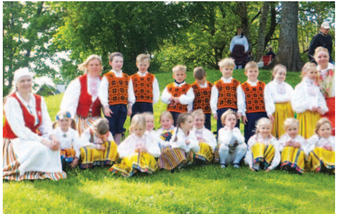
Sipelgad Nabala tantsu- ja laulupeol.

Enne Rakverre minekut sai Sipelgate rühm jalad soojaks