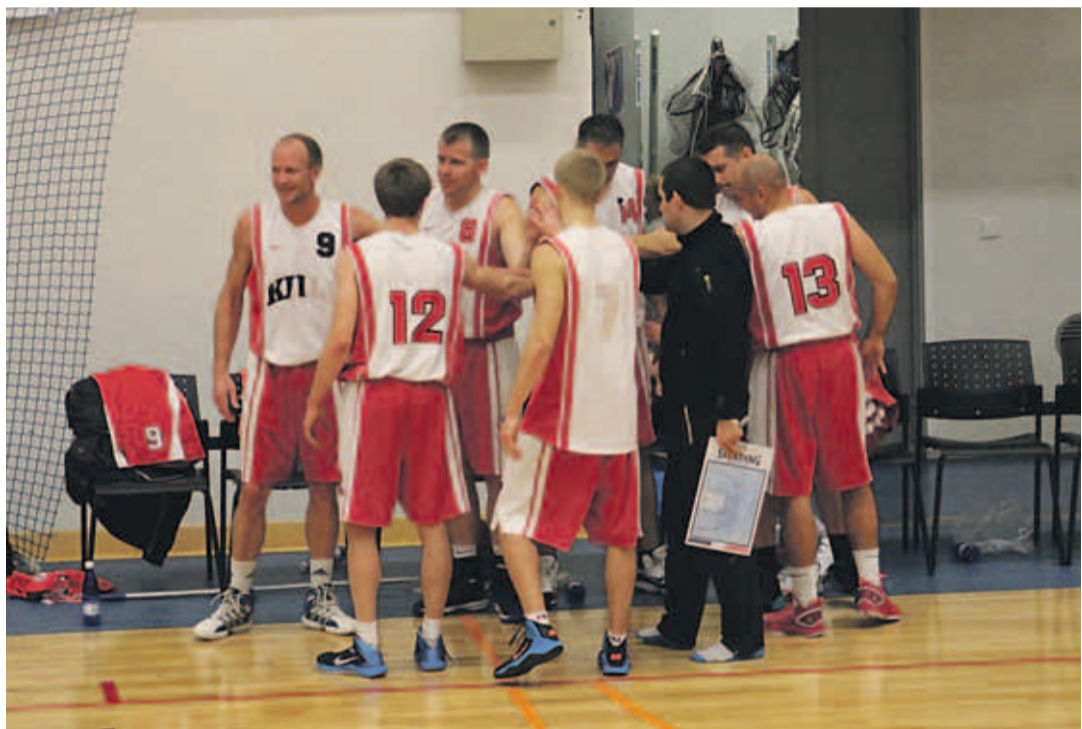
Kiili SK sai Tallinna Kossuliiga B-divisjoni põhiturniiril kolm võitu järjest.