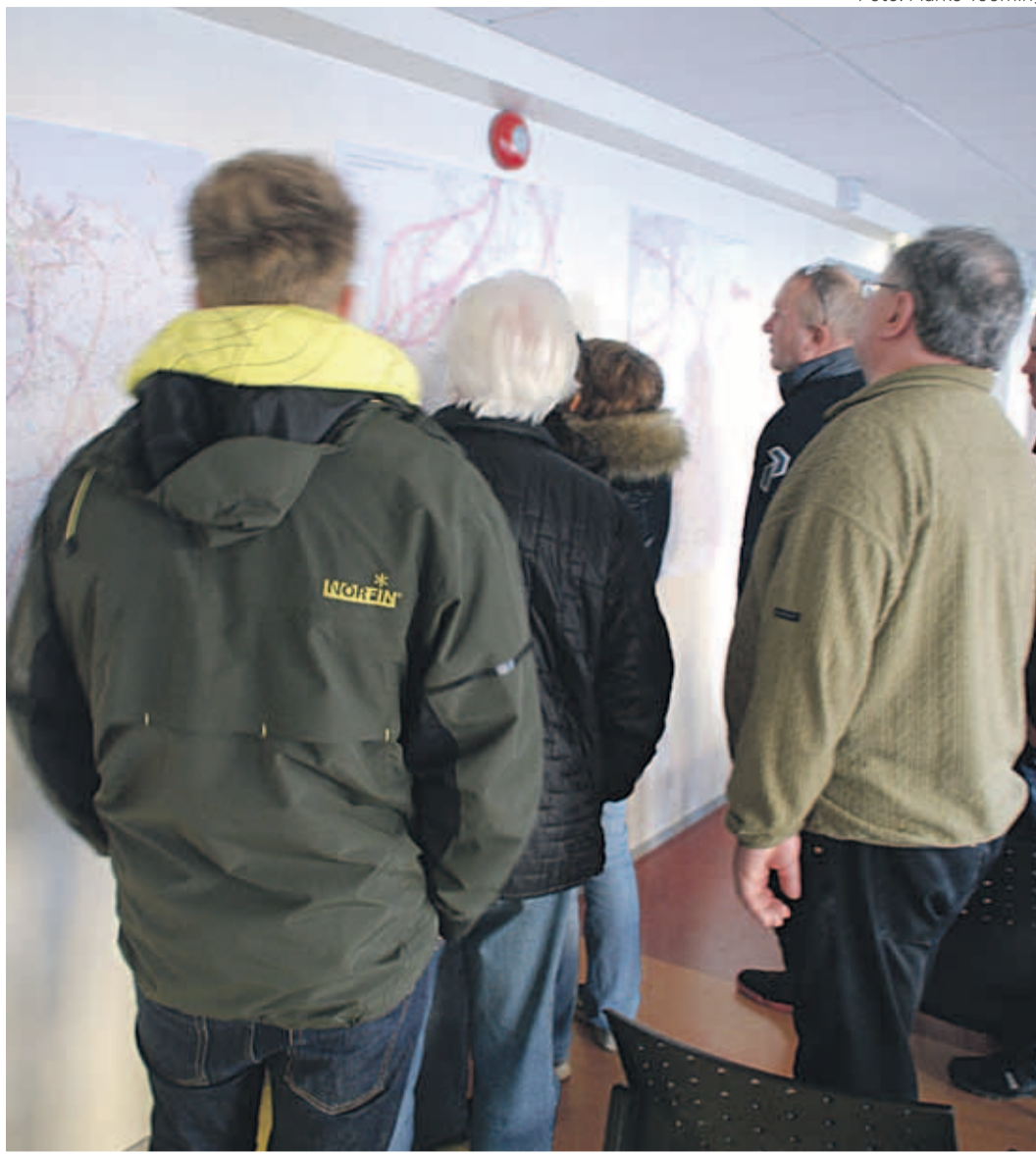
Kiili vallast on Rail Balticu planeerimise käigus trassijooni läbi veetud tõenäoliselt rohkem kui kusagilt mujalt. Trassi on kaardile joonistatud nii valla lõuna- kui keskosas. Viimane variant läbib valla põhjaosa.