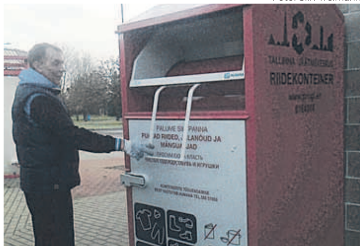
Punane konteiner Konsumi kõrval.