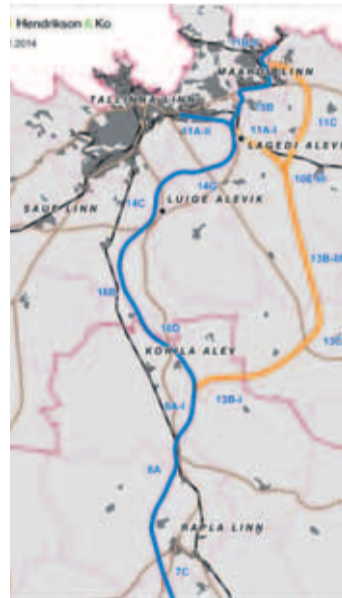
Nii näeb välja valitsuse heaks kiidetud trassivariantide kaart.

ja ka täiendavate leevendusmeetmete nõudmist, kui praegune eelistatud trassivariant jääb täpselt samaks.