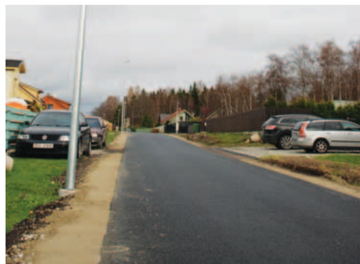
Külaseltsi eestvedamisel rajatud valgustus ja asfalttee läksid kokku maksma ca 130 000 eurot. Marko Tooming