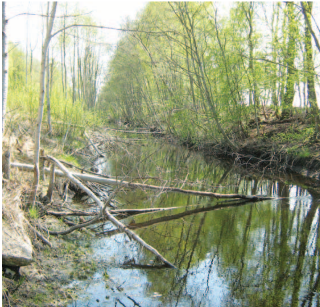
Selline nägi Vääna jõgi välja enne hooldustöid. Sete ning vette langenud puud ja võsa olid jõe voolukiirust märgatavalt vähendanud.