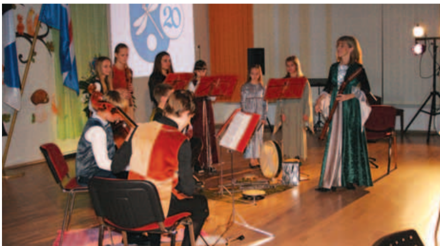
Kiili vanamuusikaansambel, mille muusikud on nooremad kui Kiili vald.