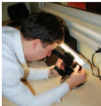
Just nii, mikroskoobiga, käib ettevõttes toodete kvaliteedikontroll.

Kiili alevi kõrvale kolis ettevõtte 2010. aastal. Peamine põhjus: logistika. Varem asuti Viimsis.