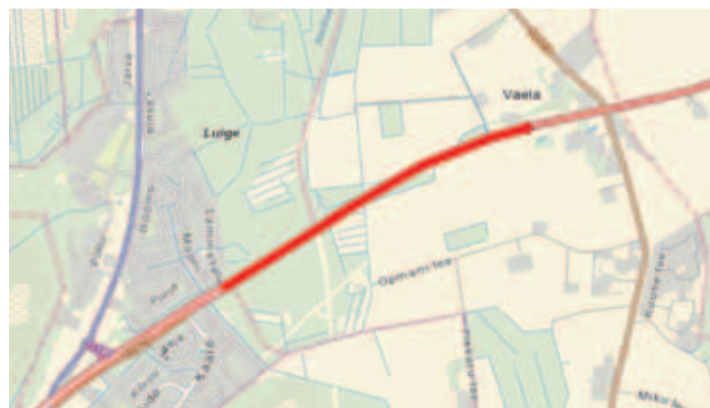
Tööd tehakse Tallinna ringtee kilomeetritel 16,1-17,9. Maanteeamet