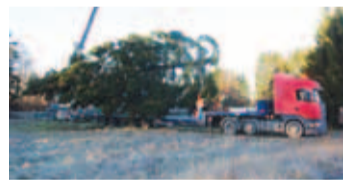
Pealinna jõulukuusk. Aimur Liiva