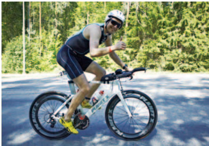
Kiili duatlon toimub 6. mail spordihalli ümbruses. 21CC Triatloniklubi