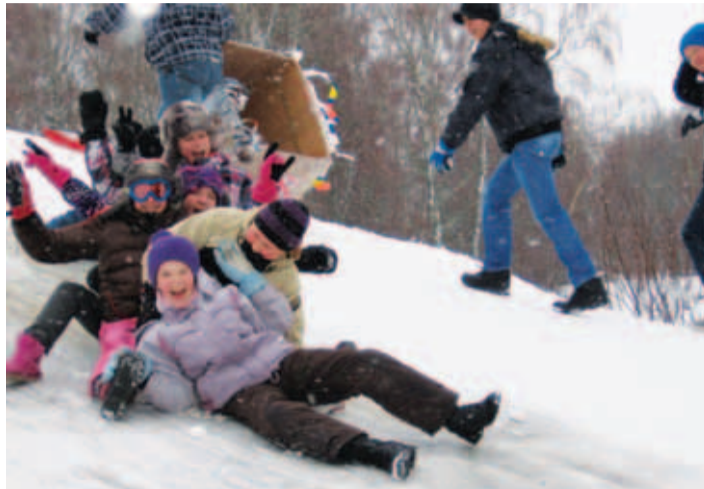
Omavalmistatud kelkudega osalesid klassid koolimaja taga asuval mäel pikima liu võistlusel. Kiili Gümnaasium