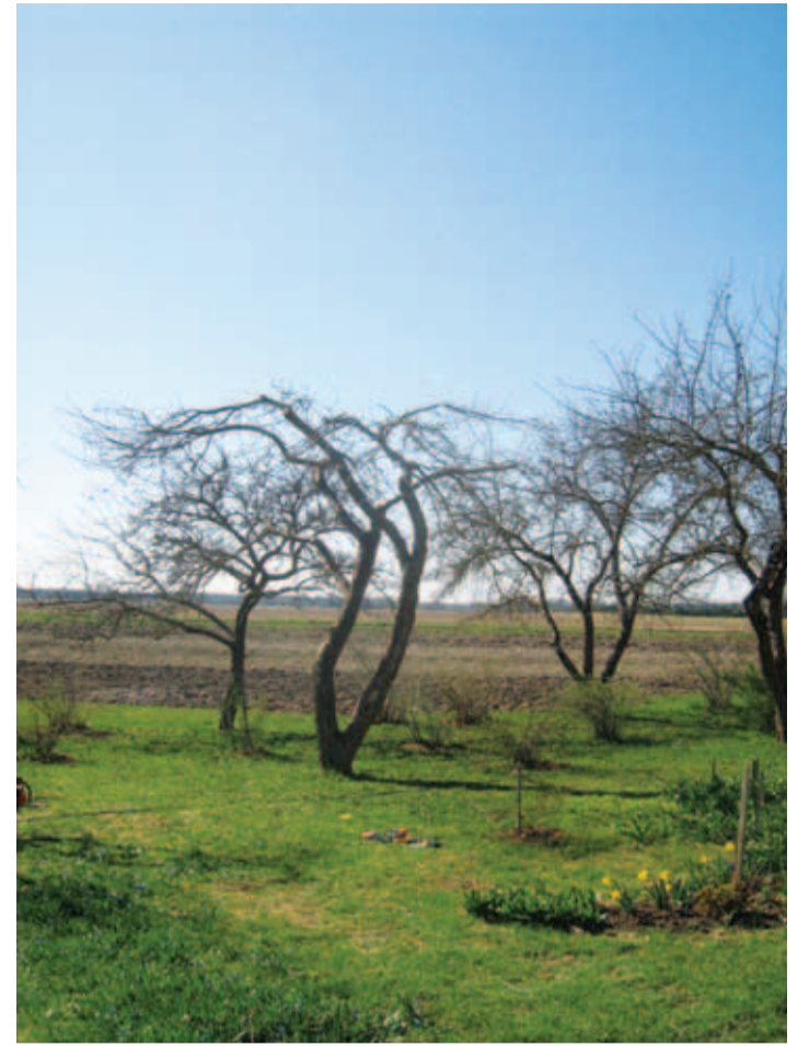
...ja pärast lõikust. 2x Piret Pihlajõe