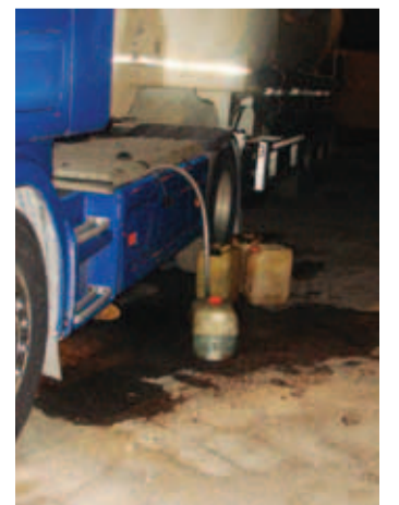
Kütusevargus Kiilis. G4S