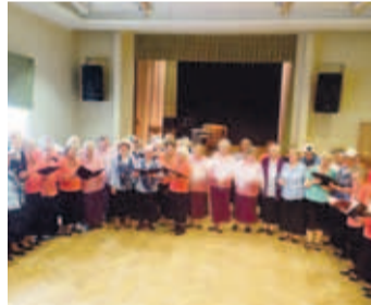
Ühislaulmine Elurõõmu sünnipäeval.