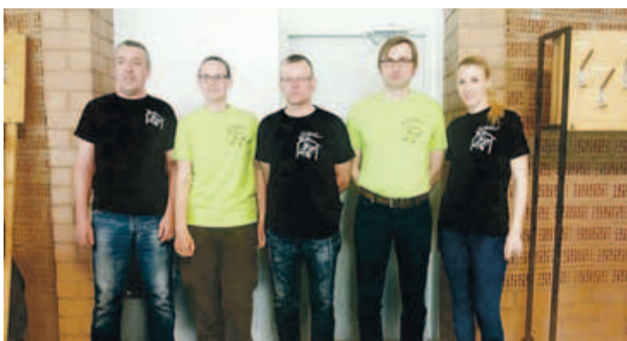
Kiili vallarahva IX sportmängude 8. ala – laskmise – võitja Sõmerlased.