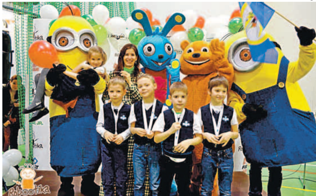
Kiili kooli robotikud.

Igal aastal esitatakse nende poolt lastele üks teema, mida lapsed peavad tundides uurima ning selle põhjal koostama ühe informatiivse plakati. Kogu töö peavad ära tegema lapsed ja õpetajal on vaid suunaja roll. Õpetaja otsest sekkumist loetakse väga halvaks ning suure-