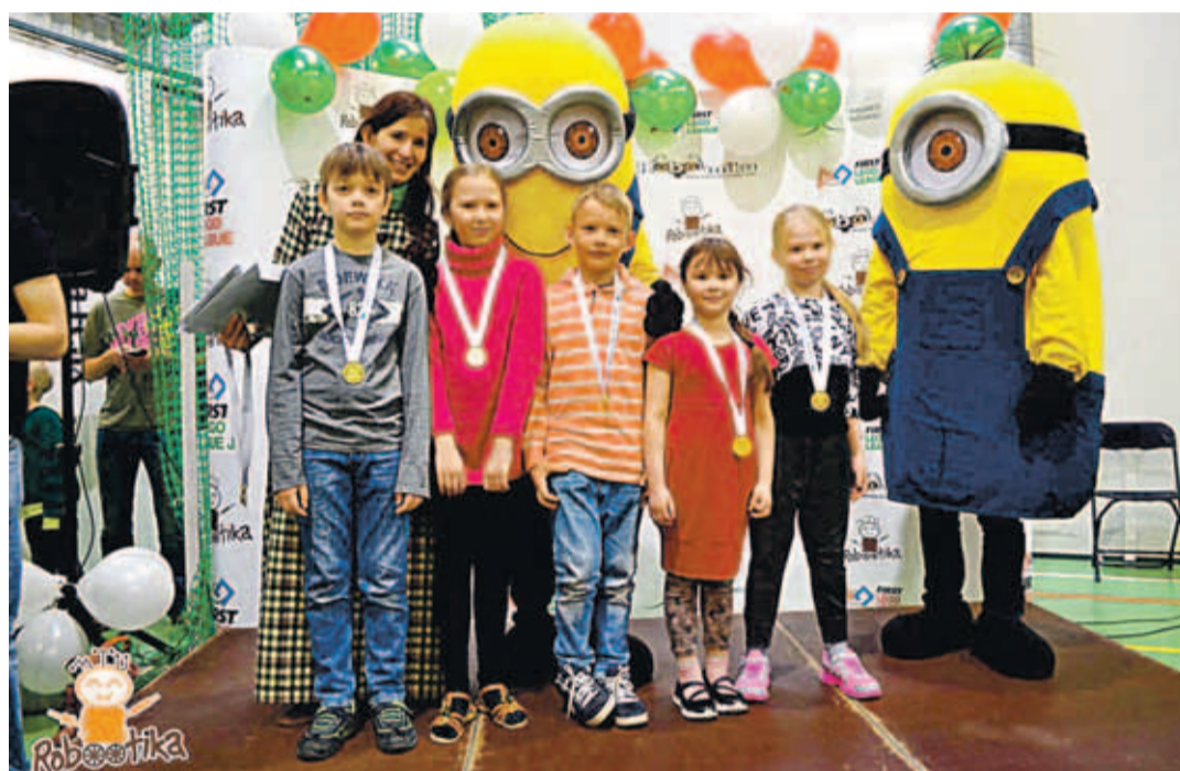
Noored robotikahuvilised Luigelt.

mate laste võistlusel eemaldatakse selle reegli vastu eksinud meeskonnad konkurentsist.