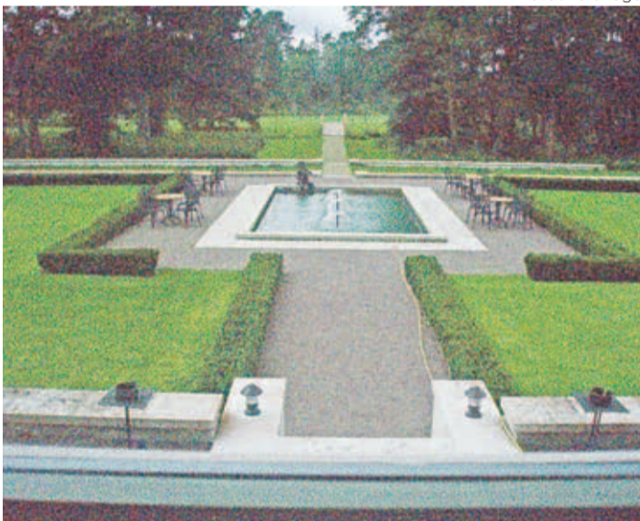
Kõltsu mõisa iluaed.