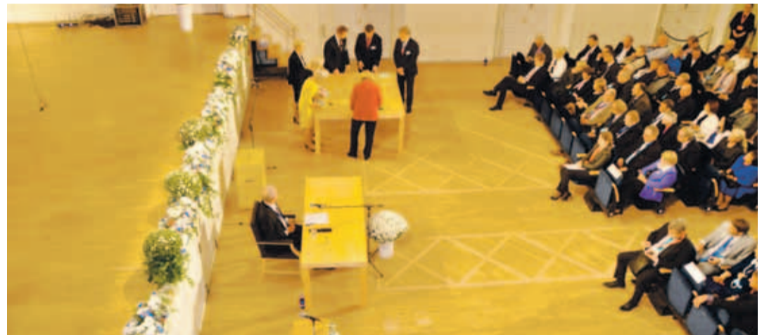
Valijameeste kogu teises voorus loeti kokku koguni 57 tühja ja kolm rikutud hääletusedelit.

kord minu jaoks keeruliseks, sest kumbki neist polnud minu esimene eelistus. Helistasin paarile sõbrale Kiili vallavolikogust ja naisele. Ega ma neist kõnedest palju abi ei saanud, päris kulli-kirja ka viskama ei hakanud. Tegin oma otsuse siiski ära ja tagantjärele on hea meel, et ei osalenud valimiste põhjalaskmises.