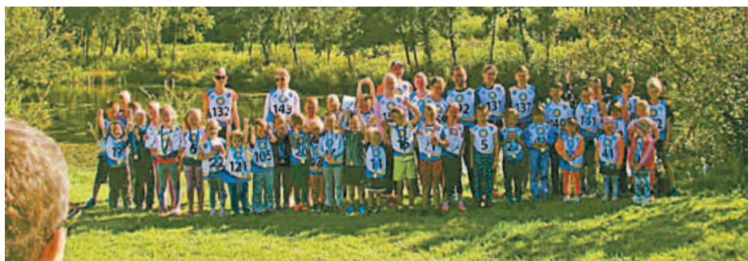
Paekna jooksust osavõtjad.

Ka hindamiseks kulub oma aeg, nii et tõenäoliselt saaksime Eesti maa ajakohasest hinnad teada alles 2019. või 2020. aastal. Nii ettenägelikud peaksime me küll juba praegu olema, et siis ei peaks enam 20 aasta vanustest maa hindadest juhinduma!