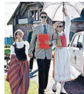
Otil peeti pidu “Rahva Võidu kolhoosi lõikuspeo” stiilis.