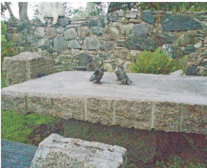
Vahvad varesed Laitses.