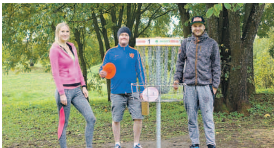
14. ala – discgolfi – võitja Kiili 2 võistkond.