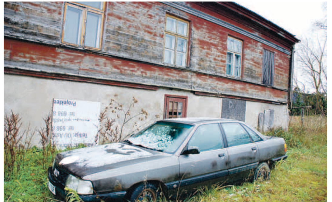
Veel hiljuti elasid räämas mõisahoones inimesed, kuid külanema sõnul ei ela praegu seal enam keegi.

Kohaliku patrioodina on tal südamest kahju, et lisaks peahoonele on nii mõnedki mõisaraajatised käest lastud. Kompleksi kuulusid mõisa hiilgaegadel lisaks häärberile viinaköök, mis hiljem muudeti õlleköögiks, jääkelder, ait, kellamaja, viljakui-vati, tallid ja karjakastell. “Praegu on kolmel hoonel korralikud omanikud – aidal, kellamajal ja