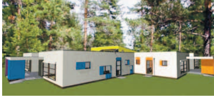
Selline hakkab Kangru lasteaia hoone välja nägema.

hoone on planeeritud neljale rühmale, lisaks saal ja muu selline," lisas ta.