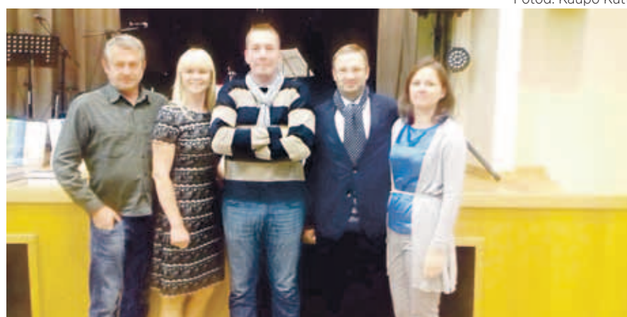
16. ala – mälumängu – võitja Kangru võistkond.