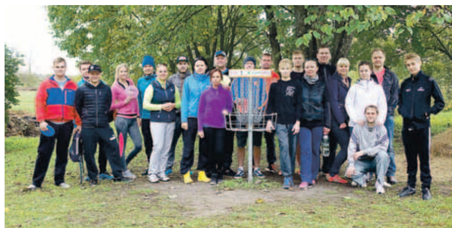
Discgolfi kõik osavõtjad.