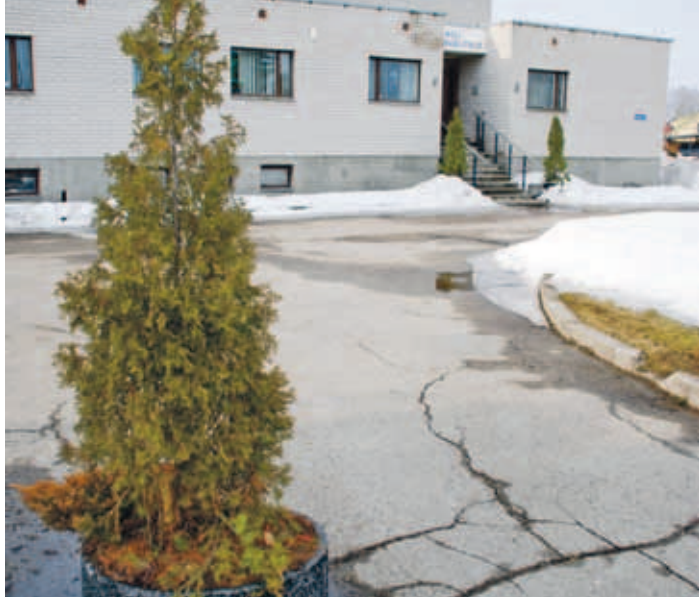
Hääletada saab jaanuaris ka Kiili vallamajas.