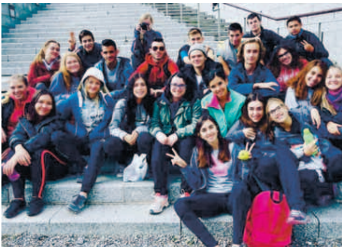
Kiili õpilased koos oma võõrustajatega.

Kõik päevad olid sisustatud hispaanlaste kooli või pere poolt. Esimesel päeval tegime esitlusi ja tutvustasime oma riike ning mängisime koolihoovis sportlikke mänge. Lõunat läksime sööma kodudesse, kus saime proovida katalaani toite. Erinevates peredes pakuti pastaroorgi, paellat, kalmaare ja kohalike magustoite, näiteks katalaani kreemi. Meid üllatas kõige rohkem see, kui palju seal saia söödi. Sai oli hommikusöögiks, teiseks hommikusöögiks (Hispaanias süüakse hommikust