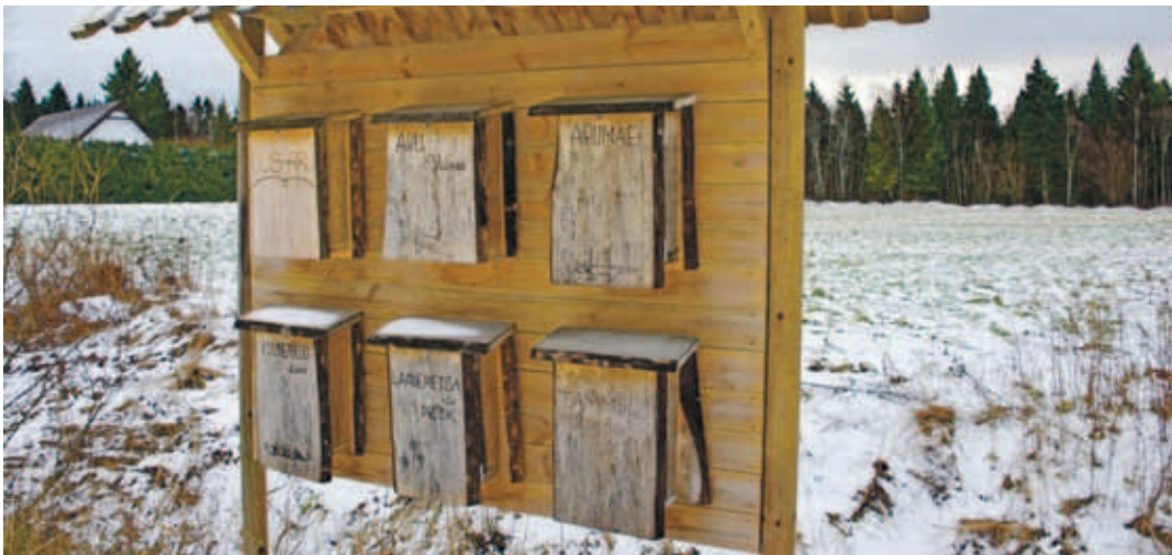
Küla postkastid on iga talu poolt ise kujundatud.