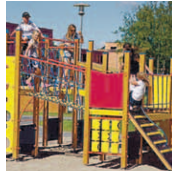
Tiptiptapi toodetud laste mänguväljak. Ettevõtte alustas tootmist Luigel.