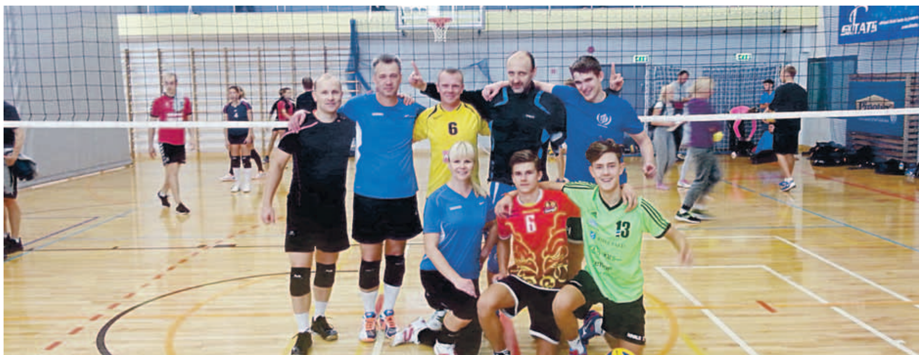
15. ala – võrkpalli – võitja Kangru võistkond.