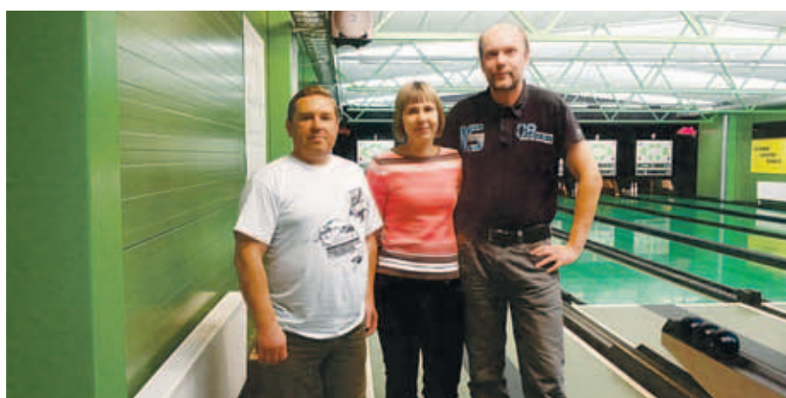
13. ala – keegli – võitja Nabala-Paekna võistkond.