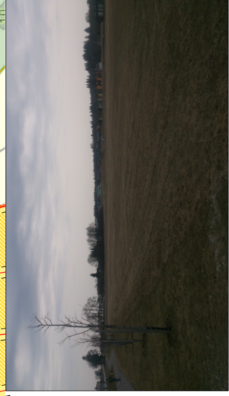
VAADE PLANEERITAVALE ALALE LÕUNAST