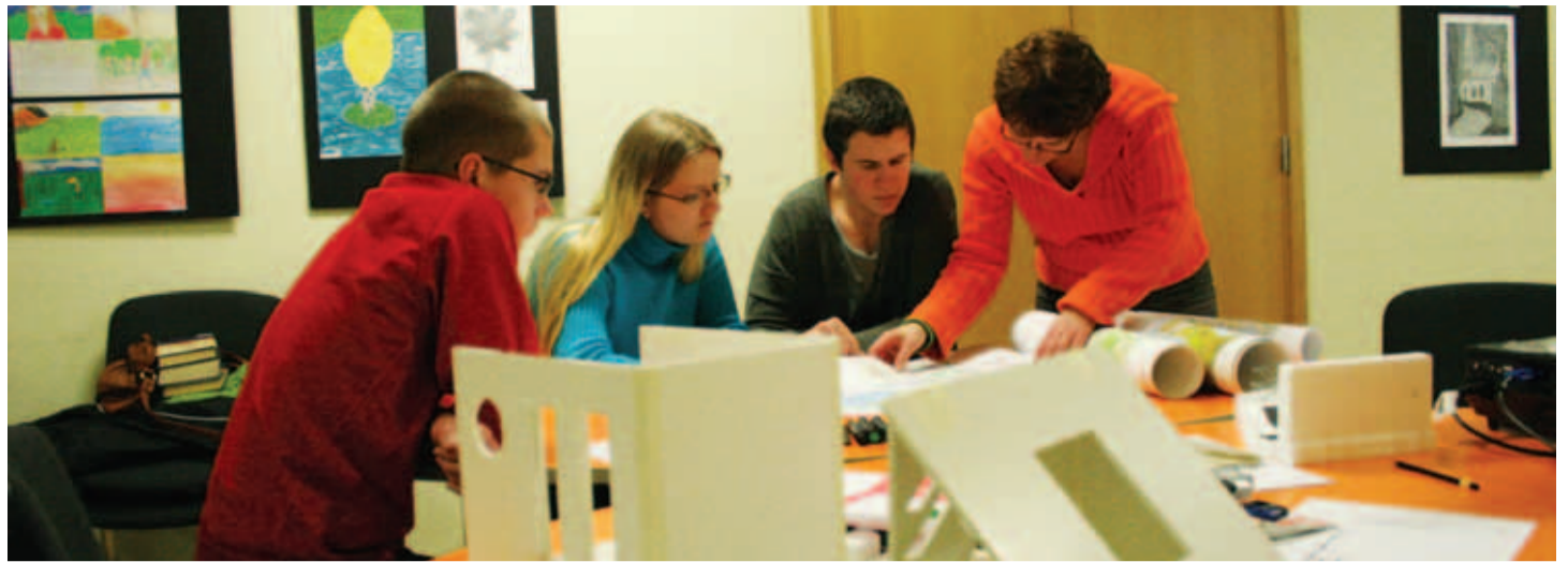
Oktoobrist veebruarini toimuvad Kiili rahvamajas arhitektuuri huvikursused.

Registreerimine reisile kuni 26.02.2012 või kuni kohti jätkub. Registreerumisel teatada osaleja nimi/nimed, isikukoodid, isikut tõendava dokumendi nr ja kehtivuse aeg. Isikut tõendav dokument peab kehtima vähemalt 3 kuud peale reisi lõppu. Bussis on istekohtade valik vastavalt registreerumisele. Kaugemalt tulijatel, kes tulevad bussile Jürist, võimalus jätta oma auto Jürisse eramaja hoovi õuele. Tallinnast pealetulek Sikupilli Prisma eest parklast ja teel Pärnu suunal.