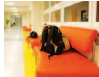
Külmematel päevadel langes temperatuur koolis +11 kraadini. Marko Tooming