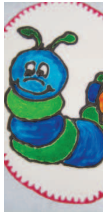
Iga lasteaiarühm sai omanäolise ja -nimelise tordi.