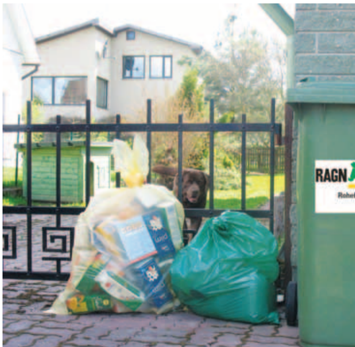
Rohelisse kotti tuleb koguda klaastaara ning kollasesse muud puhtad pakendid. Ragn-Sells