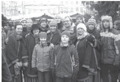
Kiili tantsijad koos Contraga Raekoja platsil.