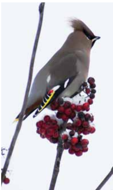
Ablas siidisaba, pildistatud 26. novembril naabri hoovis Lähse külas. Kaire Talviste

Tänaseks on aastaring täis. Neli fotokurssi ning kolm fotokurss on jätnud jälje valla ajalukku. Kui parafraaserida üht kuulsat Eesti kultusfilmi, kus ähvardati panna inimese laulu sisse, et ta sealt enam välja ei saaks, siis sama võib väita ka pildistamise kohta – see, mis pildil, sinna ka jääb.