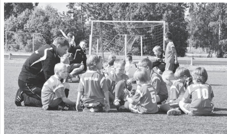
Harju Jalgpallikooli kasvandikud Soomes preemiareisil – Harju JK vs Espoo Honka. Harju jalgpallikool

Kui tekkis huvi liituda Harju Jalgpallikooliga, võtke julgusti ühendust e-maili teel info@harjujk.ee või telefonil 5690 7970. Kindlasti külastage ka meie kodulehte www.harjujk.ee.