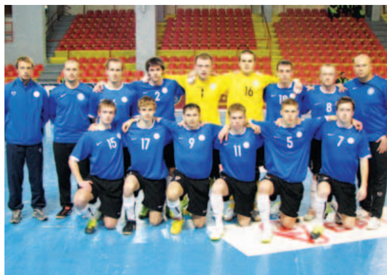
Eesti saaljalgpalli koondis.