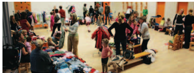
Kirbuturg Kiili lasteaias.

Pääsmete müük 1. ja 2. detsembril kell 10-12, 7. ja 8. detsembril kell 17-18.