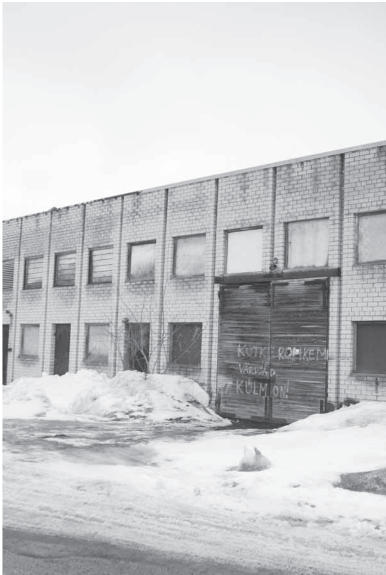
Kiili katlamaja möödunud talvel. Marko Tooming

Kuna vallavalitsusel ei ole reaalseid mõjutusvahendeid katlamaja operaatori korrale kutsumiseks,