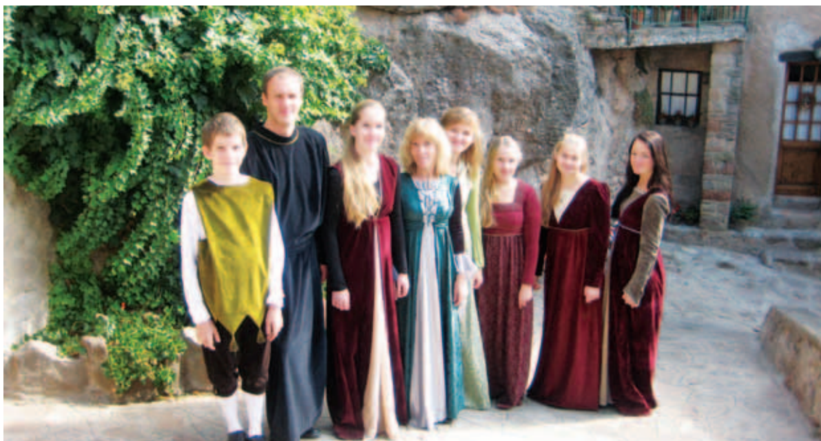
Kiili vanamuusikaansambel värvikal reisil Hispaanias.