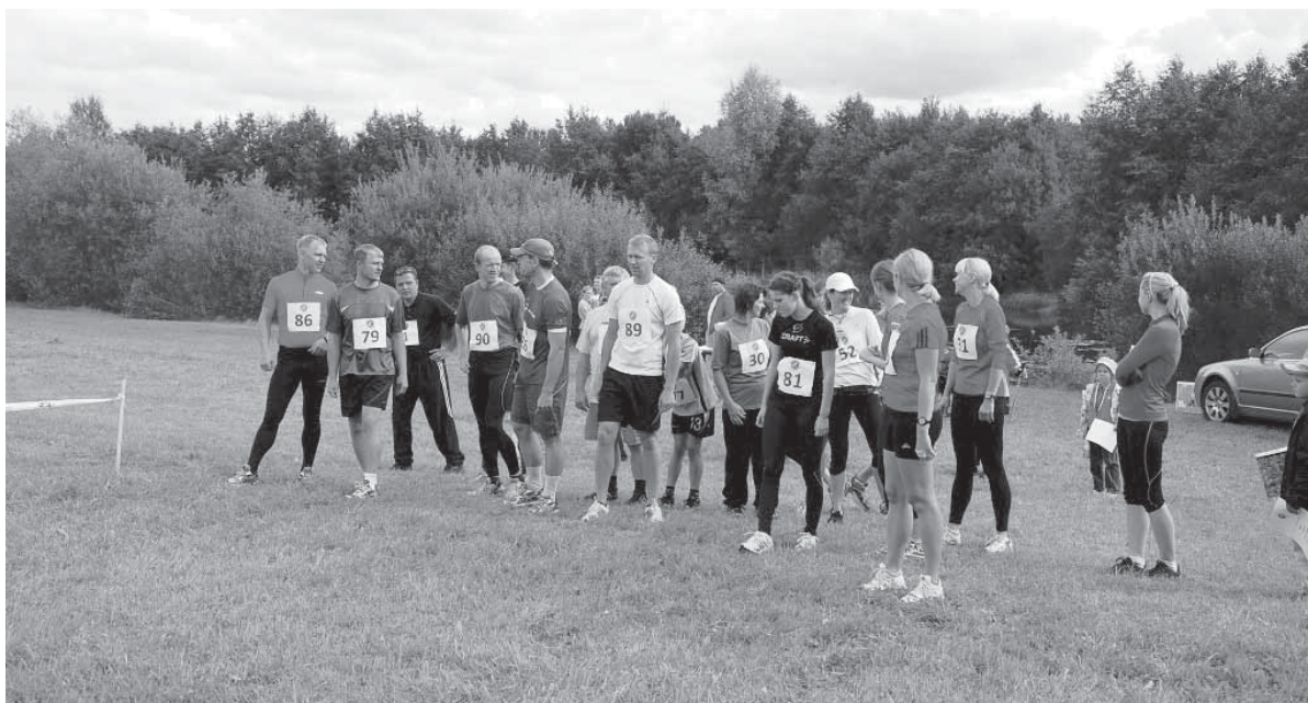
Paekna järve jooksul osales 43 jooksuhuvilist.