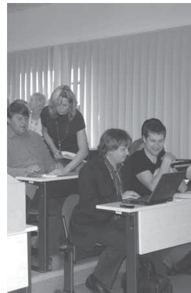
Lisaeelarve läheb kinnitamisele volikogu oktoobrikuu istungil. Marko Tooming