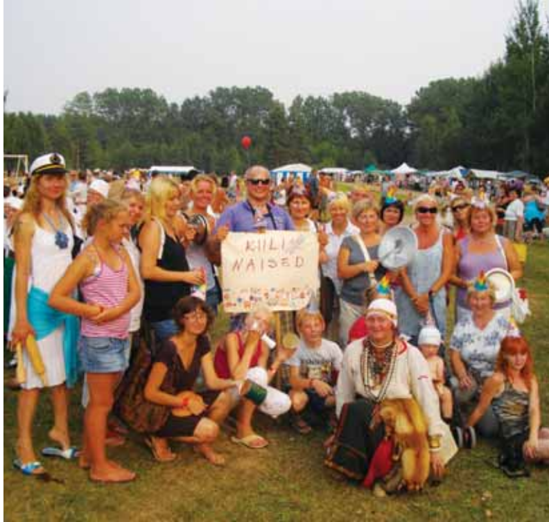
Kiili naisseltsi liikmed Setomaal külas.