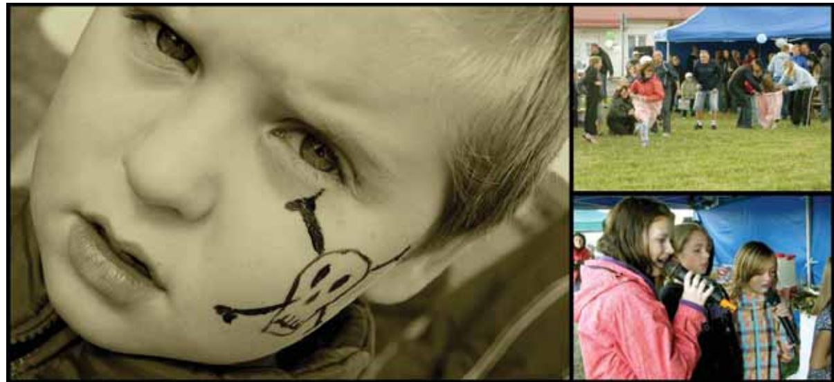
Hetked Oti küla suvelõpupeolt. Erakogu