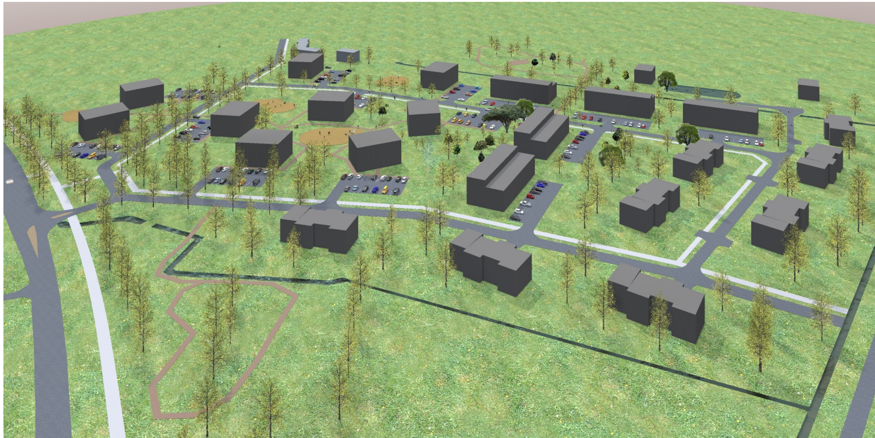
Vaade loodest kagusse