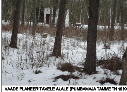
VAADE PLANEERITAVALE ALALE (PUMBAMAJA TAMME TN 15 KATASTRIOKSUSEL)