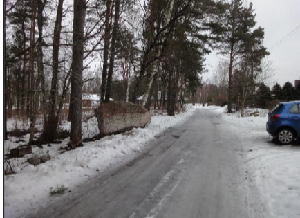
VAADE TAMME TÄNAVALE JA PLANEERITAVALE ALALE