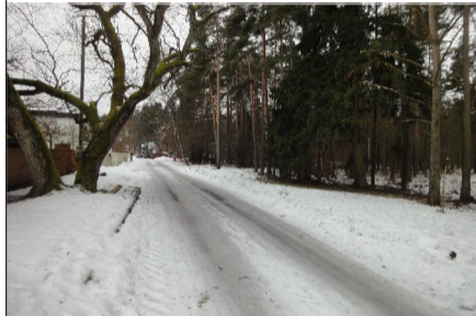
VAADE TAMME TÄNAVALE JA PLANEERITAVALE ALALE

HOONETE ESKIISLAHENDUS KOOSKÕLASTADA ENNE EHTISLOA TAOTLEMIST VALLAARHITEKTIGA.