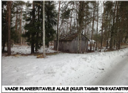
VAADE PLANEERITAVALE ALALE (KUIR TAMME TN 9 KATASTRIOKSUSEL)