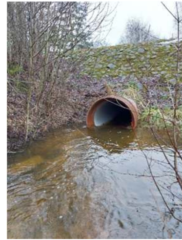
Truubi vaated allavoolu ja pealevoolu veebruaris 2025.

Truubi läbilaskevõime arvutamiseks kasutame Manningi valemit: