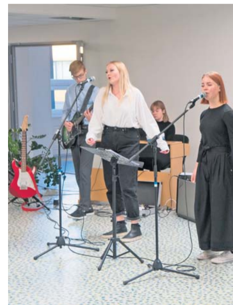
Esines ka kooli ansambel “Gymnastica”.