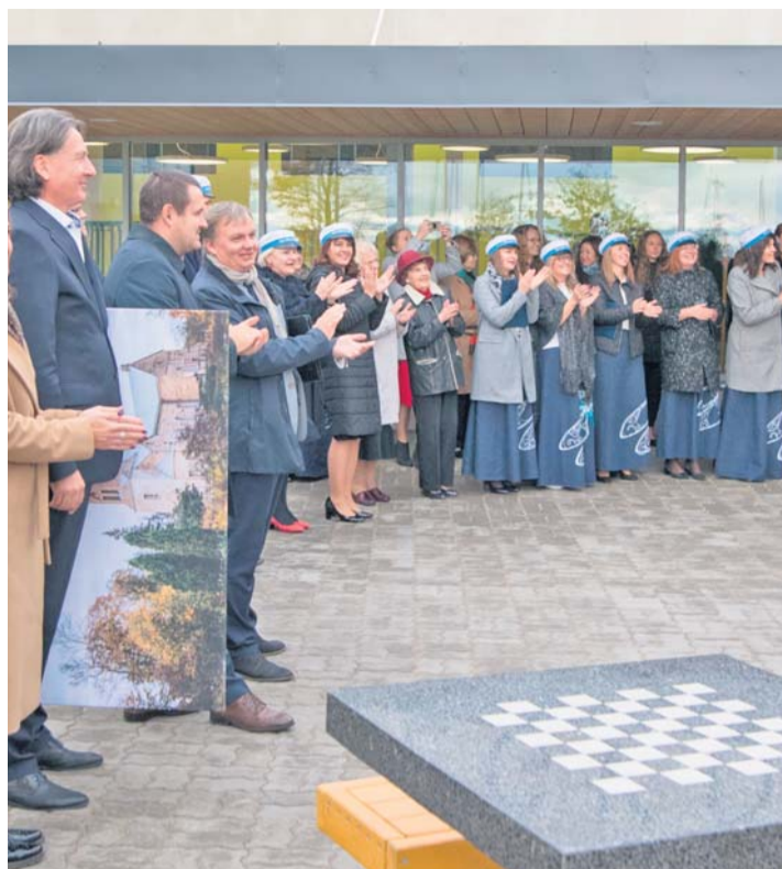
Kiilis austatakse küll traditsioone, aga lindilõikamisest otsustati kooli avamisel loobuda. Aplausi saatel langevad kuldset konfettid.