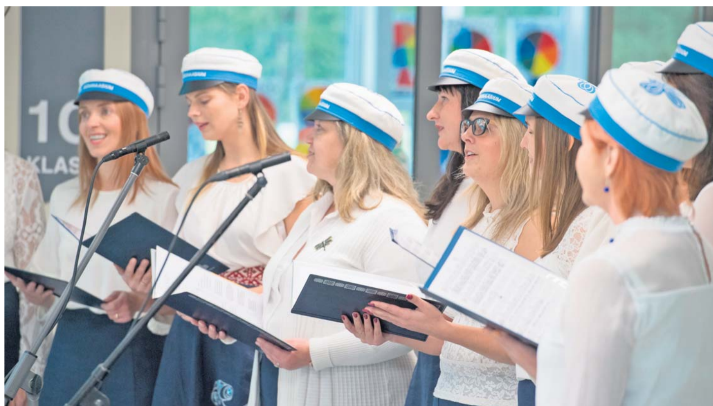
...Kiili õpetajate naiskoor