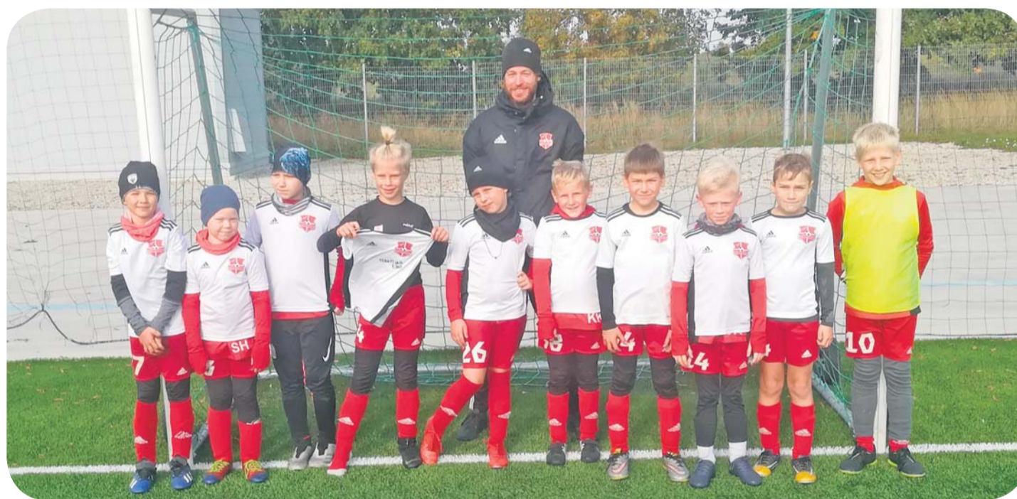
Harju JK / Rae jalgpalli võistkond.

TV 10 Olümpiastarti 2020. Harjumaa finaaloostlustes kergejõustiku mitmevõistluses (60 m; kuulitõuge; 60 m t.j.; kaugushüpe; teivashüpe; kettaheide; 1000 m; kõrgushüpe; pallivise). Kuusalu staadion. Nooremad