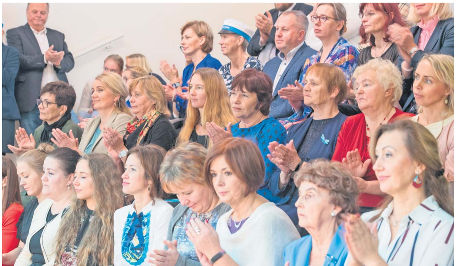
Külalisi kooli avamisele oli saanud lähedalt ja kaugelt.