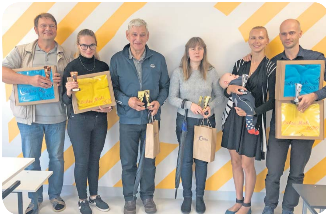
Vallarahva sportmängude üheksanda ala ehk male meeste ja naiste esikolmikud.