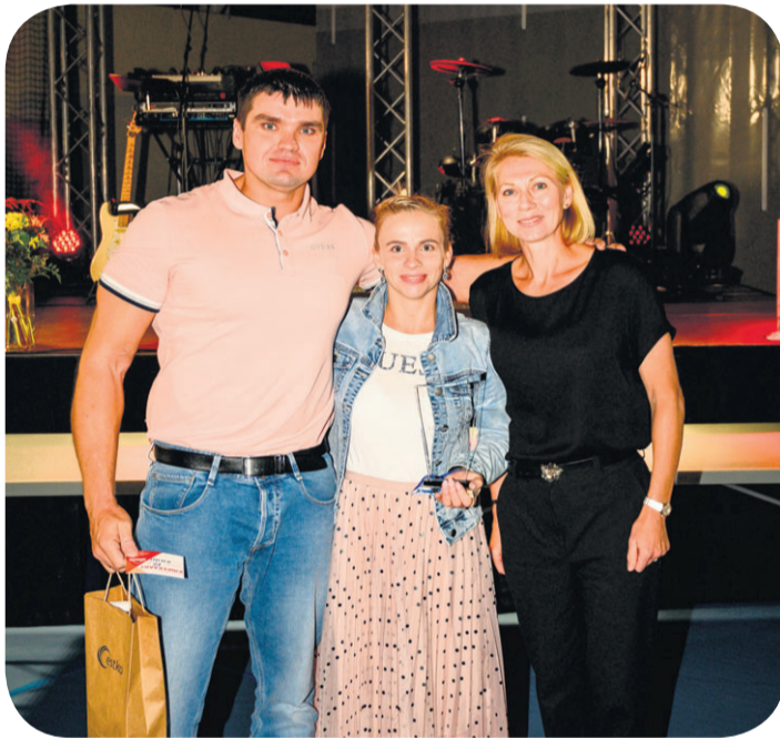
Olümpiasangar K. Šmigun-Vähi autasustamas perekond Lepametsa.