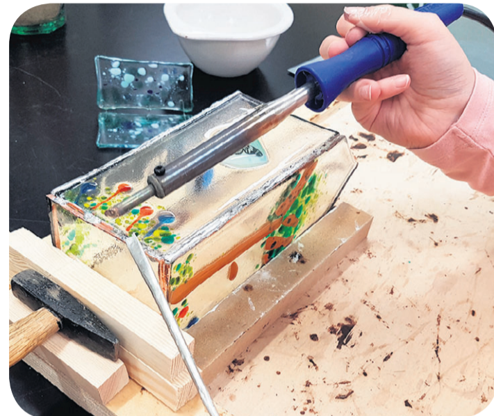
Klaasiringi põnevad ettevõtmised, vitraažmaja kokku jootmine. Qpeale Kunstiring