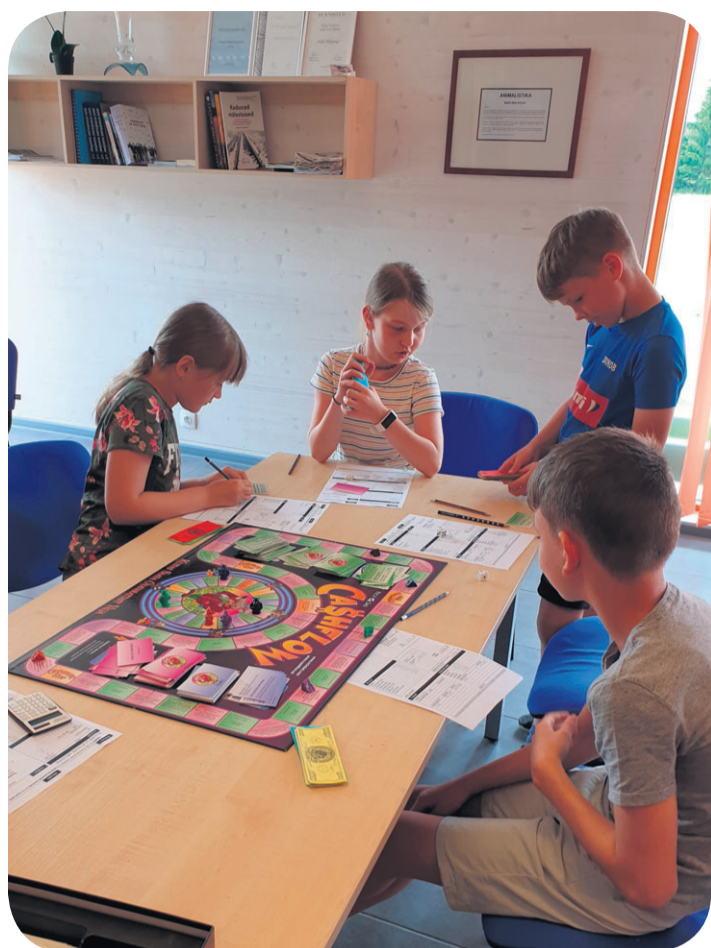
Majandusmängude laager Vaela külakojas, juuni 2020. MTÜ Mängides Targaks