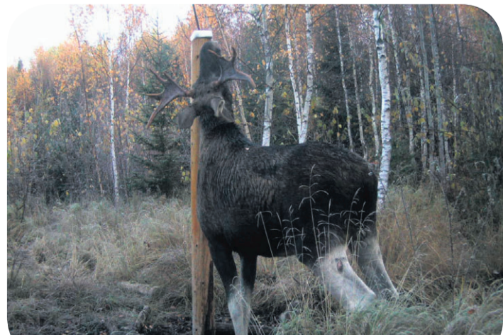
Põder, nähtuna läbi jahikaamera. Jahikaamera