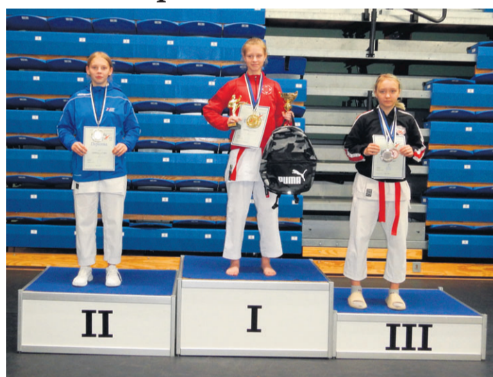
„Budo Cup 2021“ esikolmik.