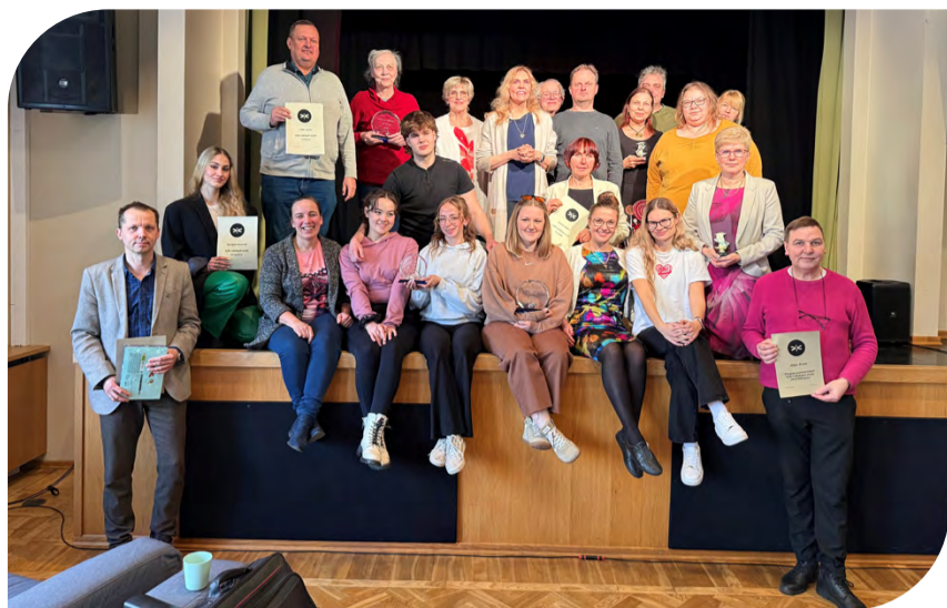
Harrastusteatri lühilavastuste festival tõi Kiili kokku 6 truppi.