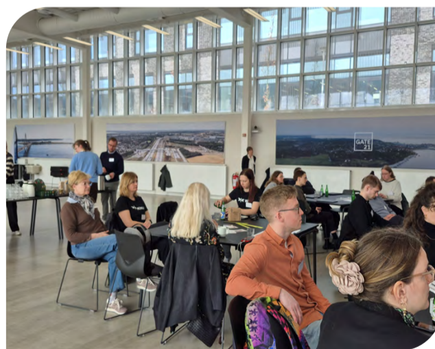
Osaleti mitmepäevasel töökohtumisel, toimus seminare, töötubasid ning saadi osa teiste projektide käekäigust.