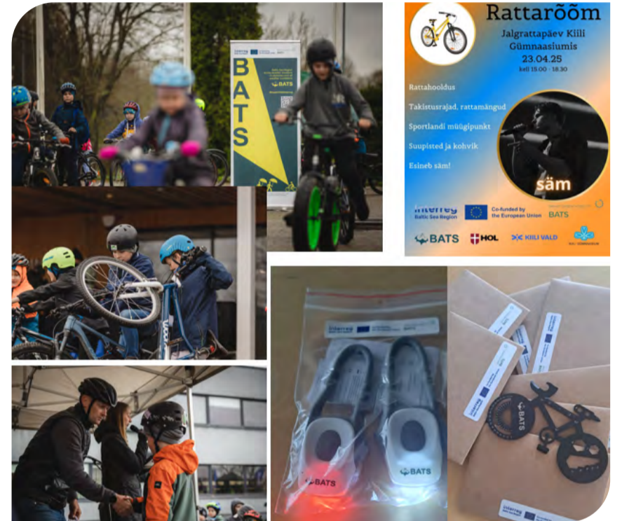
Mõned BATS projekti tegevused Kiili vallas.

Interreg Baltic Sea Region Co-funded by the European Union SMART GREEN MOBILITY BATS