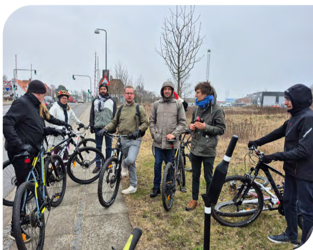
Tutvuti Kalundborgi linna rattateedega.