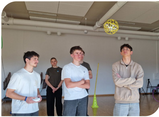
Jalgpallidroonidega on hea alustada.