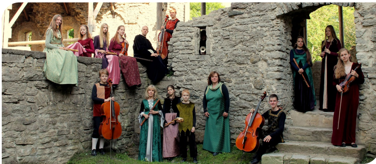
Padise kloostris CD plaadi fotosessioonil 2016. aastal.

Juhendaja jaoks on põnevaim töö sobiva repertuaari valimine. Programmis olevad lood peaks arendama ansambli kultuurilist silmaringi ning pakkuma eri tasemel muusikutele piisavalt tehnilisi väljakutseid. Samal ajal peab kontsertvalmidusse „küpsetatav“