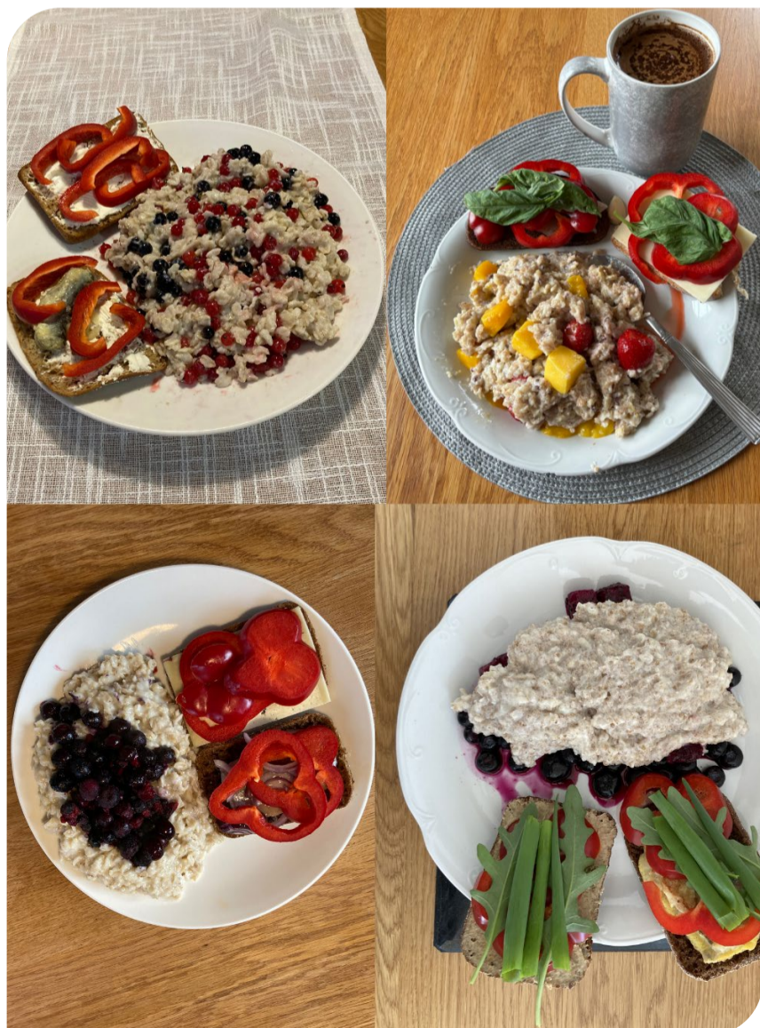
Alusta päeva tervislike ja värviliste hommikusöökidega.

„Elektrimehed“ kui uus kelmuse liik on praeguseks teadaolevalt toimunud Tallinna kortermajades. Kui elekter korterist kaob, siis helistage kõigepealt Elektrilevisse, kortermaja koridoris samaaegselt viibivat nn elektrikut ärge korterisse lubage. Kelmide suur soov ongi pääseda korterisse ning saada sellest ülevaade ning raha välja petta.