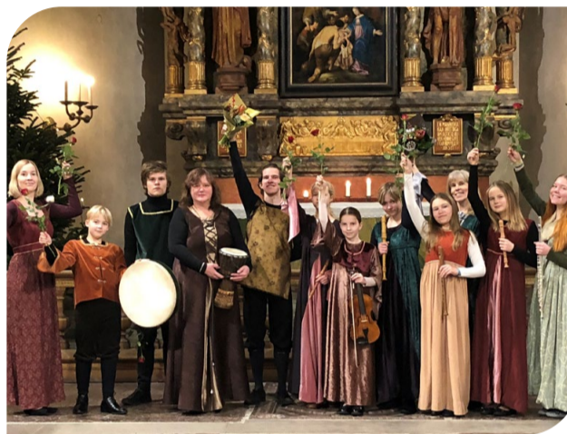
Vanamuusikud 2021. aastal.