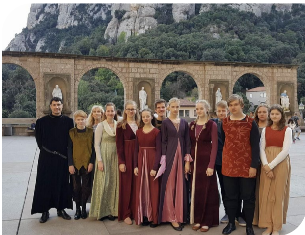
Hispaanias Montserrat kloostri õuel, 2017. aastal.