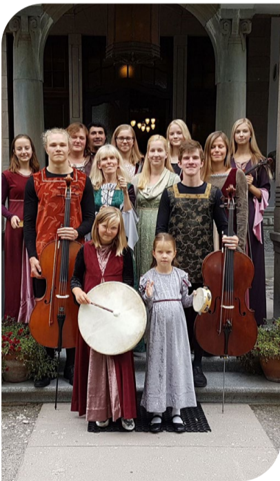
Pärnus Ammende villas, muusikafestival 2018. aasta augustis.

Kõige eredamad mälestused on siiski välisreisidelt. Esimesed käigud Soome, Kiili sõprusvalda Askolasse, üle mere Rootsi, esinemine Iirimaal Galway vanamuusika festivalil, kontserdid Hispaanias, USA ja Kanadas. Nii palju rikastavaid kogemusi, mille eest olla tänulik Heilile ja Kiili vanamuusikaansambli! Aitäh!