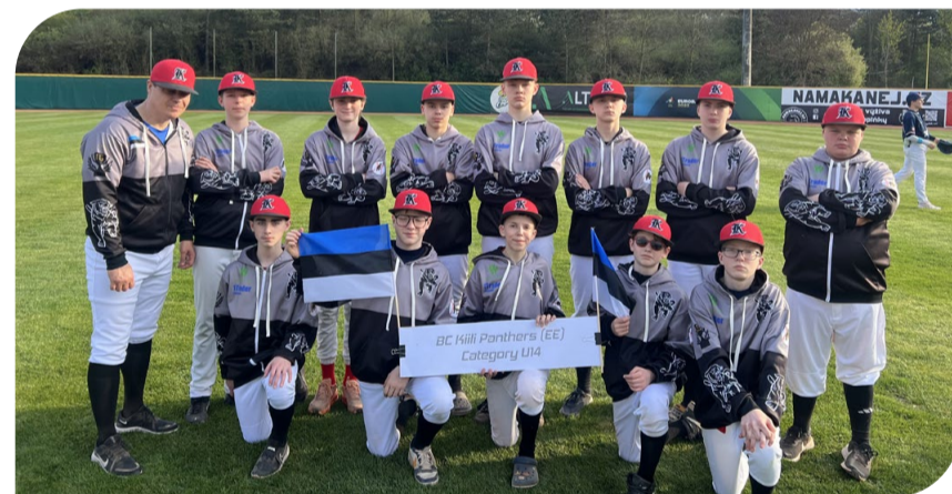
Kiili Pantrid Prahagi Eaglesi pesapalliväljakul 16. aprillil 2026. aastal.

Maikuu kohtume taas vallarahva sportmängudel 17. mail, kui toimub laste kombineeritud teatevõistlus ning Mõlkky.