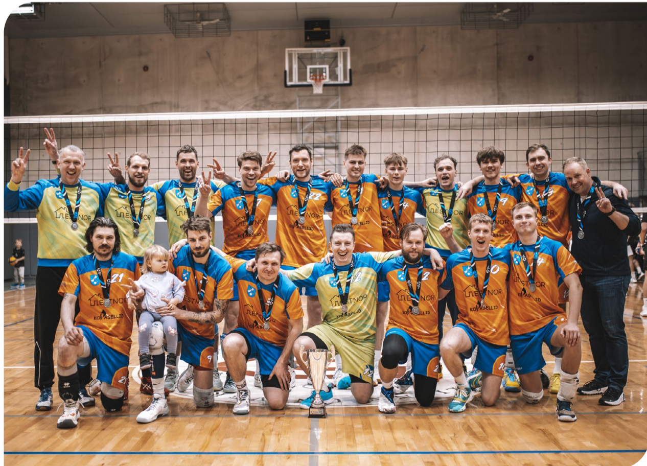
EstNor/Kiili võrkpallimeeskond jõudis meeste esiliigas üle üheksa aasta taas finaali ning pälvis hõbemedali.

Pantrite tegemistest saab lugeda nende Facebook'i lehel: Baseball Club Kiili Panthers