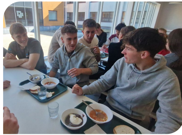
Külalised Prantsusmaalt proovivad leivasuppi.